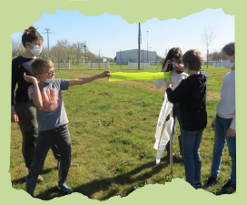
Tous les témoignages ici

Classe CM2 Ecole Souris Blanche ME des Trois-Bassins