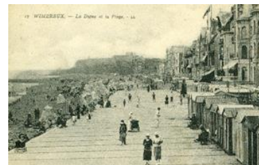
Construction de la digue en ciment