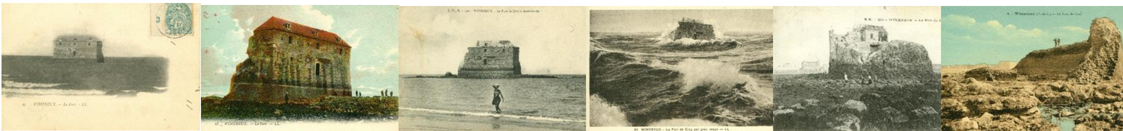
Chute du dernier morceau