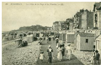
Des planches sur le sable. 50 hôtels à Wimereux.